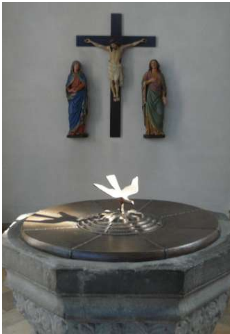
Die aus dem Kreuzaltar erhaltene Kreuzigungsgruppe am Taufstein